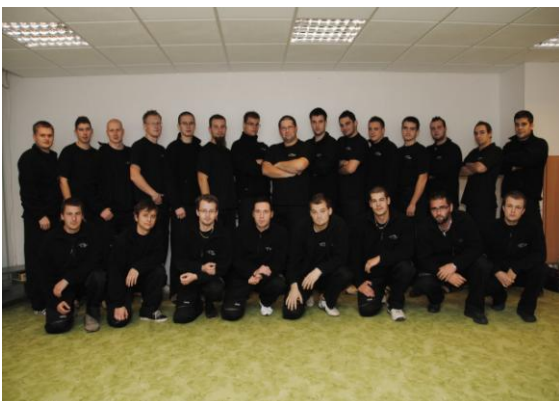
Studentagenten op de campus in Slowakije (alcoholcontrole)

Meerdere wetenschappers zijn naast het verzamelen van cijfers over het actuele drinkgedrag en drugsgebruik van studenten bezig met voorlichtingsprojecten en interventies gebaseerd op sociale normen. Studenten (en jongeren) voelen zich onder druk staan om veel te roken, drinken, drugs te gebruiken en seks te hebben omdat ze denken dat dit de norm is. Door cijfers te presenteren dat dit dus niet zo is (dus bv slechts 10% van de studenten op 18 –jarige leeftijd heeft seks i.p.v. de 90 % die men denkt) kan er ruimte ontstaan voor een omslag in het denkpatroon van de student. Daarnaast blijken alle voorlichtingsprojecten hierover ook op de nodige weerstand te stuiten omdat denkpatronen bij mensen niet gemakkelijk te veranderen zijn. Nuttig en interessant is het feit dat de manier van presenteren er dan toe doet (een zogenaamde injunctive norm i.p.v. descriptive norm). Bijvoorbeeld het vermelden : “90 % van de studenten vindt dat je pas seks moet hebben als je er zelf aan toe bent” (informatie over wat andere studenten denken dat normaal is i.p.v. wat andere studenten doen).