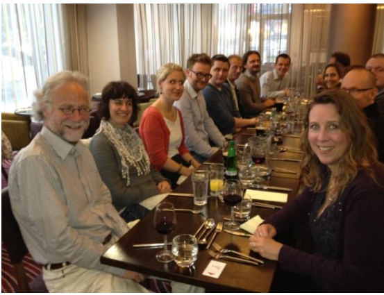
The Research group: Enjoying dinner after an intense day full of presentations